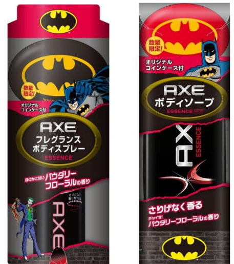
【バットマン オリジナルラバーコインケース付AXE例】