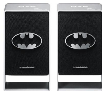
【オリジナルスピーカー】

BATMAN and all related characters and elements are trademarks of and © DC Comics.