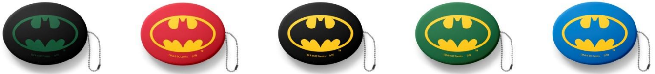
【バットマン オリジナルラバーコインケース(全5種)】