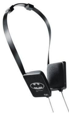
【オリジナルヘッドフォン】