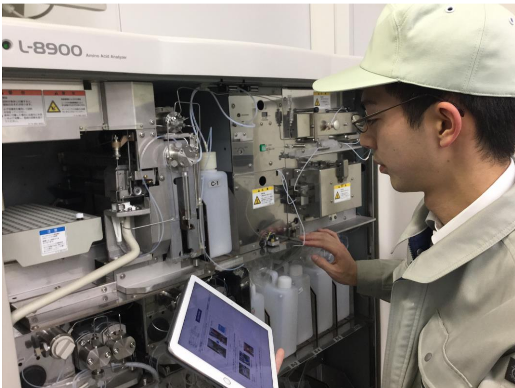
Handbook で作業手順書を参照しながら、メンテナンス作業を実施

Handbook 導入当初はミドル世代を中心としたエンジニアに対して、タブレット使用方法の理解・浸透が懸念されていましたが、直感的な操作により全員に抵抗なく使用されていることが、活用履歴の検証からも明らかになっています。