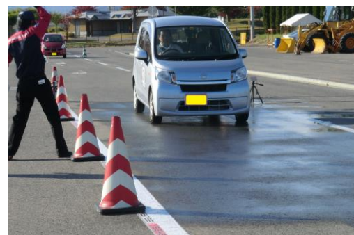
正しいブレーキ操作の実技指導

このリリースへの問い合わせは以下までお願いします。 一般社団法人 日本自動車連盟 山形支部 柏倉 Email: yamagata-jigyoo@jaf.or.jp Tel: 023(625)4520 Fax: 023(625)2366 〒990-2402 山形市小立 2-1-59