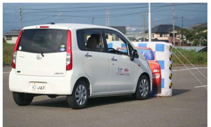
A S V（先進安全自動車）体験