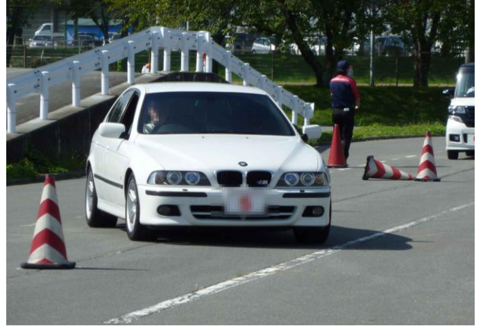
スラローム（正しいハンドル操作）