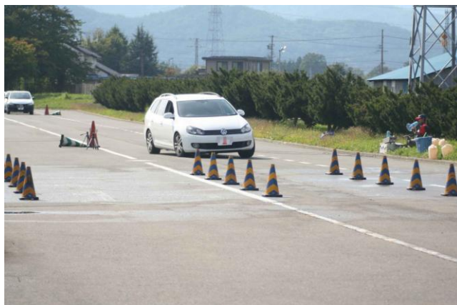
緊急回避（信号機使用）