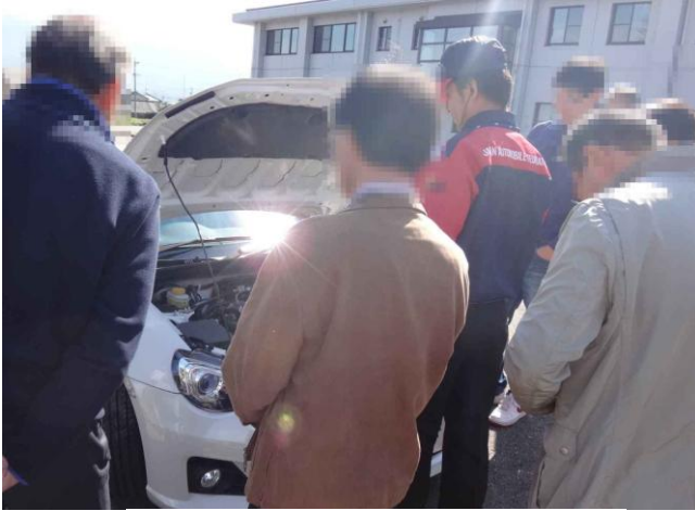
運転の基本（車両点検）