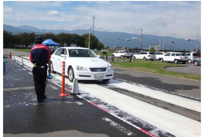
急ブレーキ体験（滑りやすい路面使用）