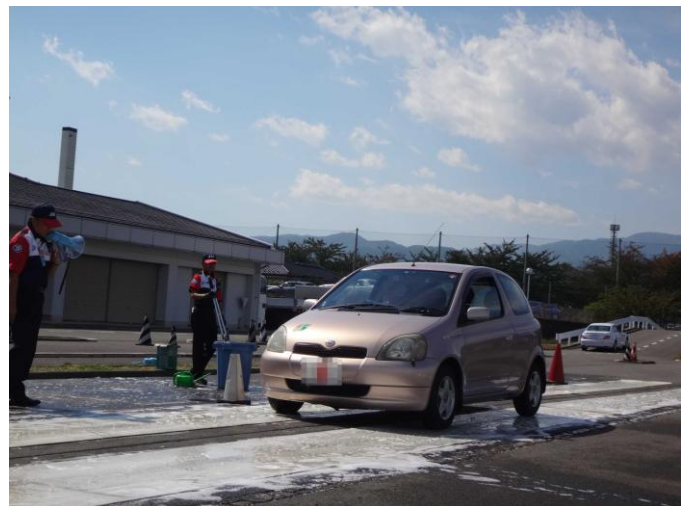
急ブレーキを体験して雪道事故防止に！

本講習会は、普段公道で体験することのできない「走る・曲がる・止まる」「見る・判断する・操作する」運転をマイカーで体験することにより、「自己の運転技量」や「車両の限界・特性」を知ることができます。一例として、雪道を想定した滑りやすい路面で急ブレーキを踏むカリキュラムがあります。また、併せて先進安全自動車（ASV：主催者用意）を体験することにより、ドライバーの安全運転を支援する「自動車の先進技術」を知り、今後の安全運転に役立てていただくものです。