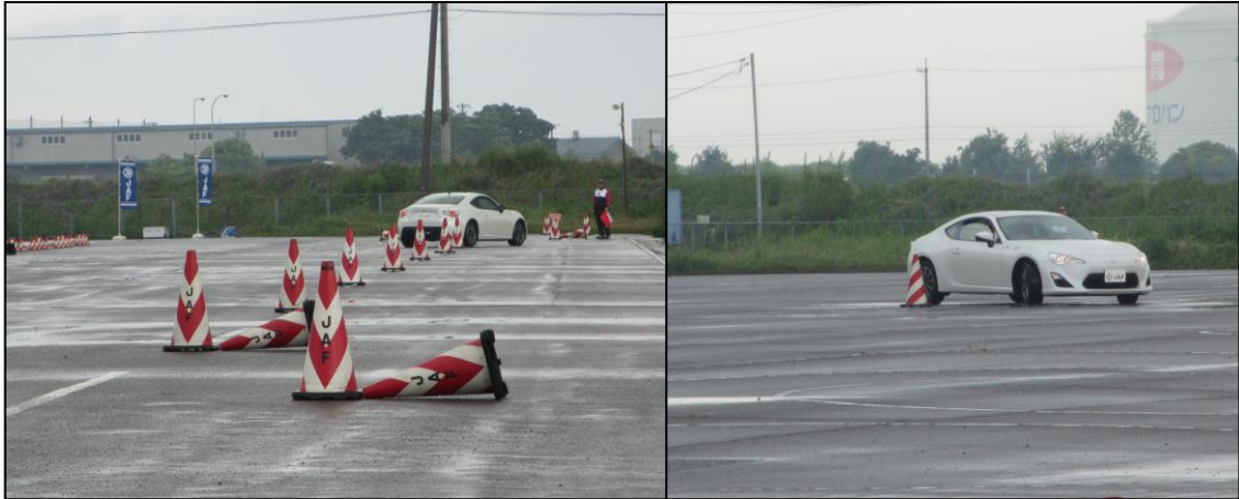
【スムーズなハンドル操作のためのパイロンスラローム】

5月16日(土)、ホンダセーフティレーシングセンター四国(坂出市江尻町1-85)において「セーフティレーシング香川」を開催しました。