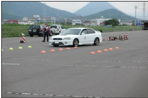
【危険回避:ハンドル操作とブレーキ】

公道では体験することのできないコースをマイカーで走行して、安全運転に必要な運転の基本操作を再確認する実技講習会です。参加者は「正しい運転姿勢」を再確認した後、スムーズなハンドル操作・緊急ブレーキ操作・先進安全自動車の体験を行いました。