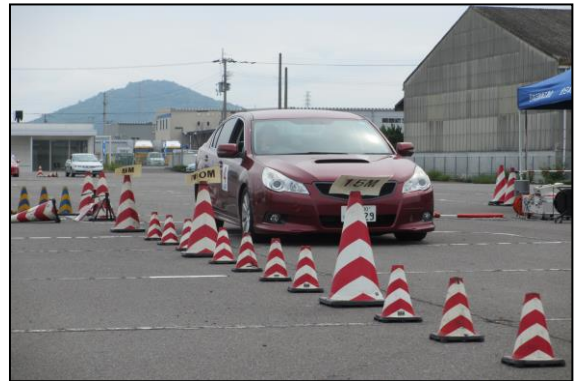
【急制動:緊急ブレーキ操作】