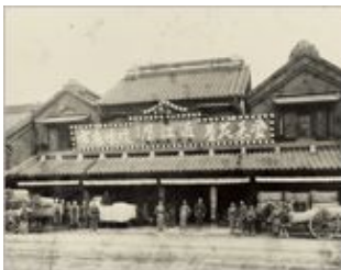
明治時代の面影を残す 明治の「日本橋 西川」