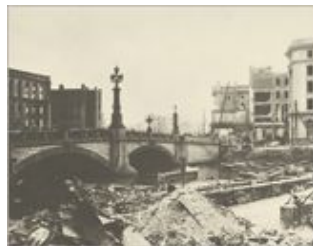
関東大震災直前 鉄筋5階建ての「日本橋 西川」と 日本橋の風景