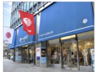
現在の「日本橋 西川」

400万円の「夢」福袋は、12月27日より「日本橋 西川」店頭に表示いたします。 ご取材をご希望の際は下記宛にご連絡ください。※12月27日以前のご取材も対応いたします。