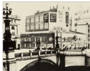
昭和8年頃の日本橋と “西川のかや・ふとん”の ネオンがついた「日本橋 西川」