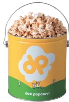
タイニー缶(1ガロン)