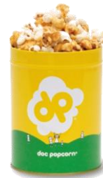
クォート缶(1/4ガロン)

FSプランニングは、「Doc Popcorn」の日本1号店となる旗艦店「Doc Popcorn 原宿店」を、2014年5月31日（土）にオープンいたしました。オープン初日は行列5時間待ちの大盛況になるなど、原宿店での人気を受け、これまで東京駅GRANSTAやそごう横浜などの商業施設、長崎県・岡山県のフードイベントに期間限定で出店し、人気フレーバーが初日で売り切れるほど、多くの方にお買い求めいただいております。