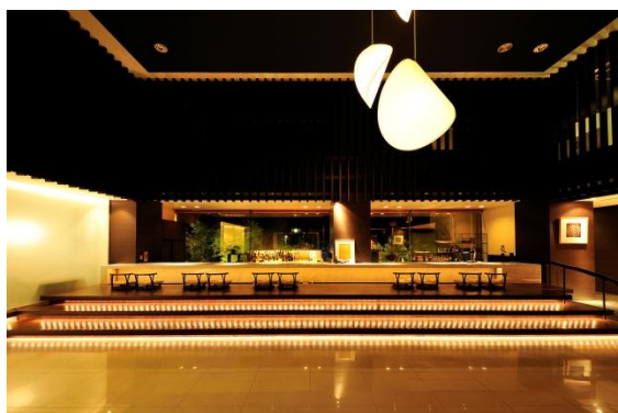
ロビーに置かれた足湯カフェバー