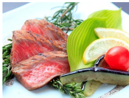
【鉄板で調理する牛ステーキ】