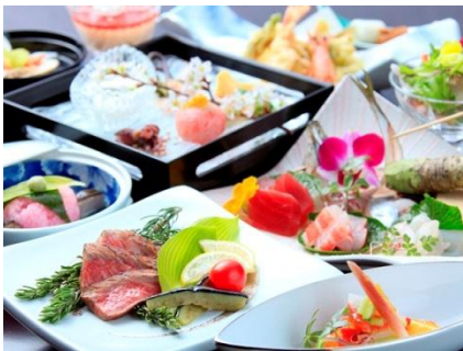
【スタンダード鉄板会席~風 kaze~】

ゆとりろ熱海が提案する新感覚の旅館ステイの代表が、お客様の目の前で調理し、出来立てを提供するライブキッチンスタイル。視覚・嗅覚・味覚・感覚・触覚の“五感”を全て使って愉しむ創作和食をコースで提供。熱海という立地でライブキッチンという新しいスタイルを提案しながら、他の旅館との差別化を図る。