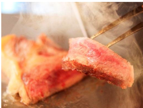
【目の前で調理する鉄板焼料理】