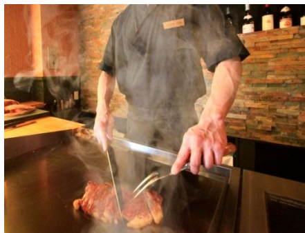
【パフォーマンス愉しめるライブキッチン】