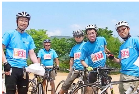
写真:「CYCLE AID JAPAN 2012」大会風景