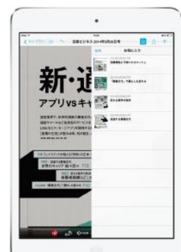
気になった記事を保存(ブックマーク)