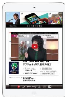
各号の読みどころ、インタビューなど、iPad版限定の動画・音声コンテンツを閲覧