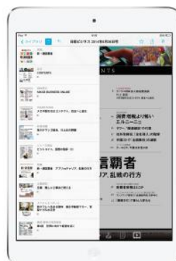
目次ボタンでいつでも読みたい記事に移動