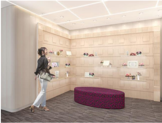
エントランス（イメージ図）