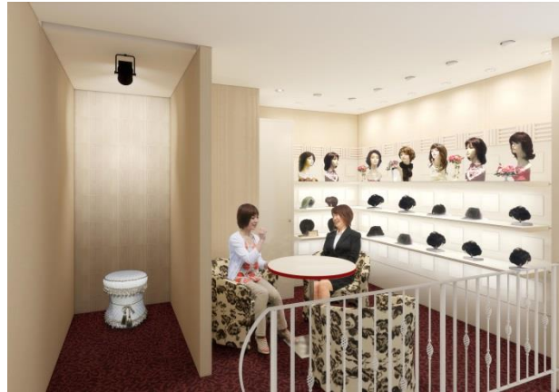
スタイル・ミュージアム（イメージ図）