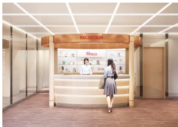
女性サロン（イメージ図）