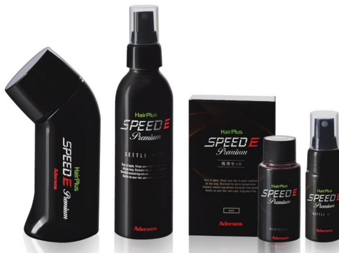
ヘアプラス スピードE プレミアム

※2：ポリクオタニウム-51、加水分解コラーゲン、アロエベラ葉エキス、セージ葉エキス、オタネニンジン根エキス、カミツレ花エキス、ツボクサエキス、カンゾウ根エキス、チャ葉エキス、イタドリ根エキス、ローズマリー葉エキス、オウゴンエキス