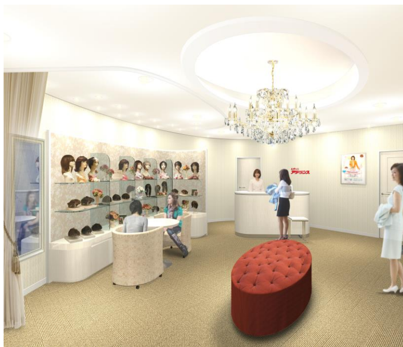
「レディスアデランス町田」 (イメージ図)

アデランスでは、近年ウィッグをファッションとして楽しむ女性が増加しているのを背景に、さまざまな髪型をお楽しみいただける「スタイル・ミュージアム」の導入店舗を拡大しております。今回移転リニューアルする「レディスアデランス町田」は、多摩地域有数の商業地として急速な発展を遂げる町田市の中心部に位置し、上質な空間と心からのおもてなしで地域のお客様をお迎えいたします。