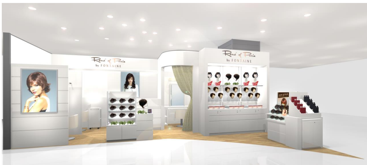
『ルネ オブ パリス by フォンテーヌ エムアイプラザ 旭川店』 (イメージ図)

「エムアイプラザ 旭川」が入居する「イオンモール旭川駅前」は、イオンが旭川市に今春グランドオープンするショッピングモールです。旭川駅直結という都市型の複合施設として、食やエンターテインメント、ファッション・雑貨など、地域の方々に新たなライフスタイルを提案します。「ルネ オブ パリス by フォンテーヌ」では、このような恵まれた立地条件を活かしながら、日々のコーディネートにプラスするだけで簡単にお洒落を楽しめるウィッグの魅力をお伝えしていきます。