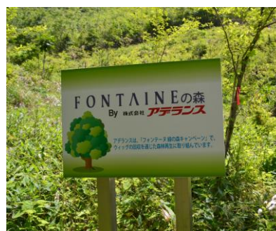
フォントーン緑の森