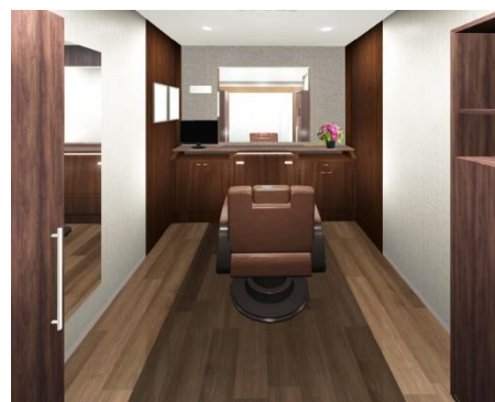
「アデランス成田」女性用ブース （イメージ図）