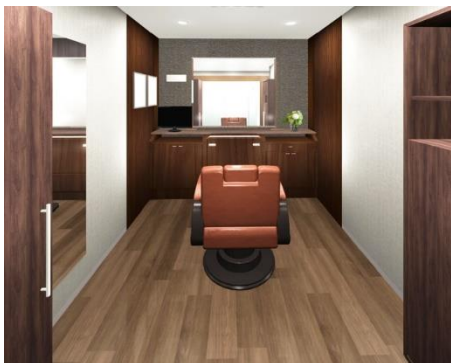
「アデランス成田」男性用ブース （イメージ図）

店内には、周囲を気にせずリラックスしてご利用いただける個室のブースを男性用3室、女性用2室ご用意し、より周囲を気にせずにご相談いただける、プライバシーに配慮した空間に設計いたしました。カウンセリングルームには、頭皮の状態をチェックし、お客様にご覧いただきやすいよう大型モニターを設置しました。