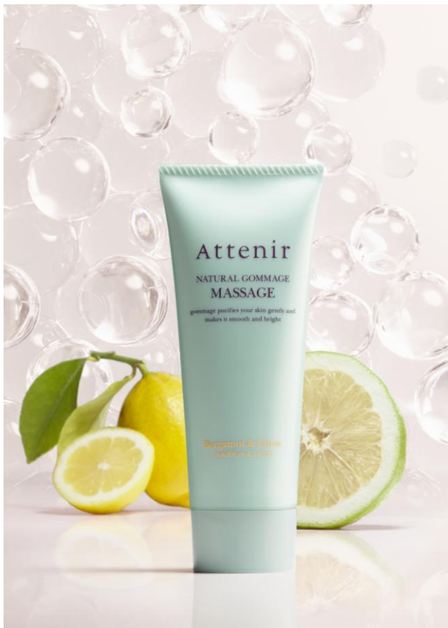
みずみずしく深みのある柑橘の香りをプラス。

*5つの植物保湿成分 ゴールデンカモミール・カミツレエキス・フィーメールマントル®・スーパーゼニアオイエキス・オオアザミ果実エキス