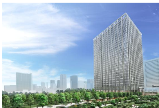
「品川シーズンテラス」外観

（参考：品川シーズンテラス ホームページ http://www.shinagawa-st.com/ ）