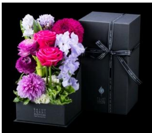
Porter Box(S) 「Precious」 ¥5,400 16×16×26(cm) <ダリア・バラ・ヒヤシンス・ランタンキュラス・スイトピー・アジサイ> 可愛らしさと大人っぽさを表現したシックなボックスフラワーは、持ち運びもスマート。ボックスを開けた瞬間の驚きも演出。