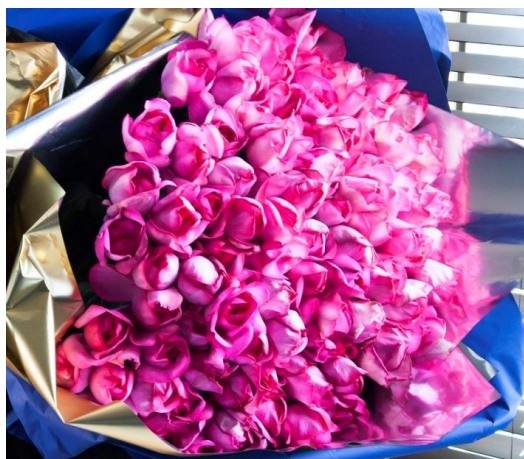
Bouquet 「Nocturne」 ¥108,000 φ70×70 <イヴピアジェ> バラの中でも愛らしく、華やかな香りが人気の「イヴピアジェ」。100本分の思いと香りは、生涯記憶に残るサプライズになります。

・販売期間: 2017年2月15日(水)~3月10日(金)20時まで ※11日以降のご要望は店舗までお問い合わせください ・お渡し期間: 2017年3月4日(土)~3月14日(火)