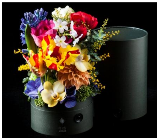
RoundBOX 「Cheers!」 ¥10,800 φ16×28(cm) <ランタンキュラス・ファレノプシス・チューリップ・ヒヤシンス> 丸いボックスを開ければ春らしいカラフルな花が溢れ出し、驚きが増す。360°、見る角度で異なるデザインは見る人を自然に笑顔になります。