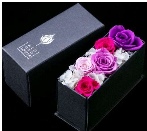
SaintJordi Box-preserved flower-「Me too」 ¥2,700 6×13×7(cm) <バラ・アジサイ> コンパクトなボックスにバラとアジサイが存在感を放つ。永く咲き誇るプリザーブドフラワーにメッセージやプレゼントを添えて。