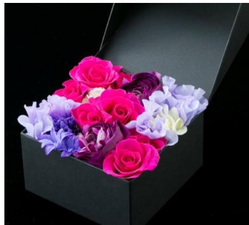
Jewelry Box 「Emotion」 ¥3,780 13×13×7(cm) <スプレーバラ・スイトピー・ランタンキュラス・ヒヤシンス・アジサイ> 花を一面に敷き詰めたボックスにジュエリーを忍ばせて贈ればより華やかに。ヒヤシンスの甘い香りも印象的です。