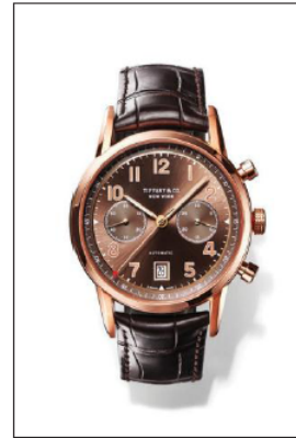
ティファニー CT60 18k ローズゴールドケース クロノグラフ機能付 ケース径 42mm 自動巻き ブラウン“ソレイユ”ダイヤル ブラック アリゲーター ストラップ 346683832/¥1,895,000