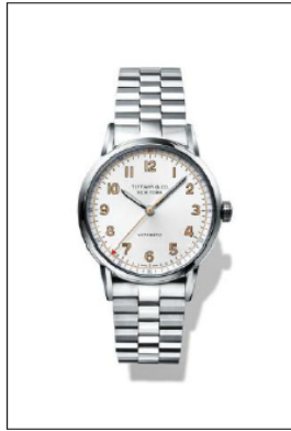
ティファニー CT60 ステンレススチールケース ケース径 34mm 自動巻き ホワイト“ソレイユ”ダイヤル 34668329/¥535,000