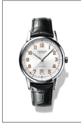
ティファニー CT60 ステンレススティールケース ケース径 40mm 自動巻き ホワイト“ソレイユ”ダイヤル ブラック アリゲーター ストラップ 34667802/¥595,000