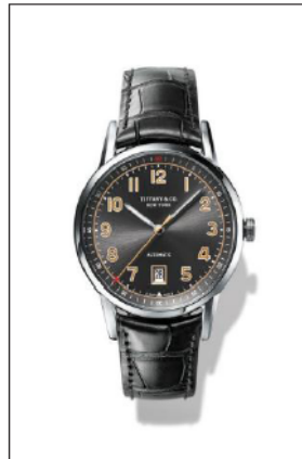
ティファニー CT60 ステンレススティールケース ケース径 40mm 自動巻き グレー“ソレイユ”ダイヤル グレー アリゲーター ストラップ 34667934/¥595,000