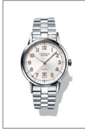
ティファニー CT60 ステンレススティールケース ケース径 40mm 自動巻き ホワイト“ソレイユ”ダイヤル 34668272/¥660,000