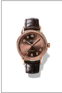
ティファニー CT60 18k ローズ ゴールドケース 合計 60 石のラウンドブリリアントカット ダイヤモンド付 ケース径 34mm 自動巻き ブラウン“ソレイユ”ダイヤル ブタン アリゲーター ストラップ 34685282/¥1,940,000