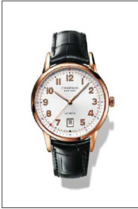
ティファニー CT60 18K ローズゴールドケース ケース径 40mm 自動巻き ホワイト“ソレイユ”ダイヤル ブラック アリゲーター ストラップ 34683859/¥1,505,000