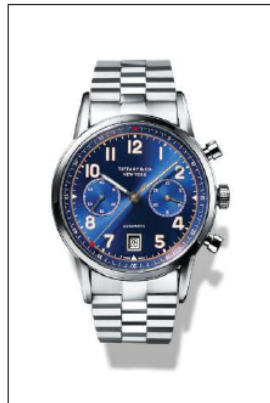
ティファニー CT60 ステンレススティールケース クロノグラフ機能付 ケース径 42mm 自動巻き ブルー“ソレイユ”ダイヤル 34677298/¥910,000