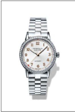
ティファニー CT60 ステンレススチールケース 合計 60 石のラウンドブリリアントカット ダイヤモンド付 ケース径 34mm 自動巻き ホワイト“ソレイユ”ダイヤル 34668353/¥1,100,000