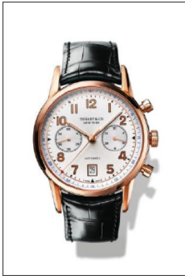
ティファニー CT60 18k ローズゴールドケース クロノグラフ機能付 ケース径 42mm 自動巻き ホワイト“ソレイユ”ダイヤル ブラック アリゲーター ストラップ 346683816/¥1,895,000