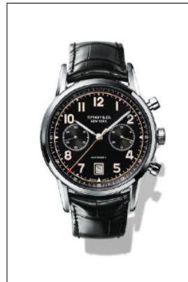
ティファニー CT60 ステンレススティールケース クロノグラフ機能付 ケース径 42mm 自動巻き ブラック“ソレイユ”ダイヤル ブラックアリゲーターストラップ 34668418/¥850,000