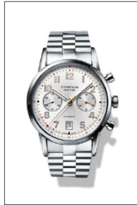
ティファニー CT60 ステンレススティールケース クロノグラフ機能付 ケース径 42mm 自動巻き ホワイト“ソレイユ”ダイヤル 34677271/¥910,000