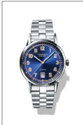
ティファニー CT60 ステンレススティールケース ケース径 40mm 自動巻き ブルー“ソレイユ”ダイヤル 34668299/¥660,000