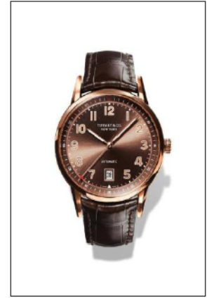
ティファニー CT60 18K ローズゴールドケース ケース径 40mm 自動巻き ブラウン“ソレイユ”ダイヤル ブラウン アリゲーター ストラップ 34683867/¥1,505,000