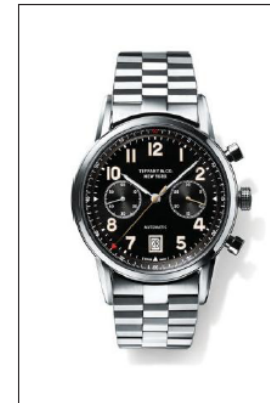
ティファニー CT60 ステンレススティールケース クロノグラフ機能付 ケース径 42mm 自動巻き ブラック“ソレイユ”ダイヤル 34677301/¥910,000