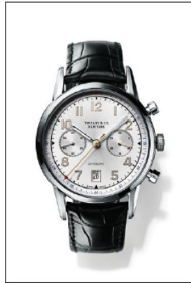
ティファニー CT60 ステンレススティールケース クロノグラフ機能付 ケース径 42mm 自動巻き ホワイト“ソレイユ”ダイヤル ブラック アリゲーター ストラップ 34668388/¥850,000