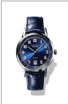
ティファニー CT60 ステンレススティールケース ケース径 40mm 自動巻き ブルー“ソレイユ”ダイヤル ブルー アリゲーター ストラップ 34667926/¥595,000