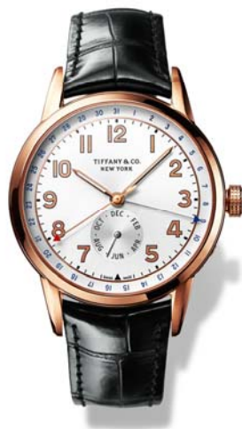
ティファニー CT60 カレンダー 18k ローズゴールドケース ケース径 40mm 自動巻き ブラックアリゲーター ストラップ ¥2,405,000(税抜)

これらのコレクションは、4月2日より全国のティファニー ブティックにて発売いたします。