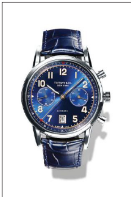
ティファニー CT60 ステンレススティールケース クロノグラフ機能付 ケース径 42mm 自動巻き ブルー“ソレイユ”ダイヤル ブルー アリゲーター ストラップ 34668396/¥850,000