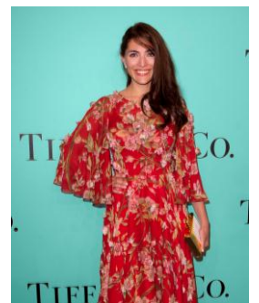
来場したセレブリティ (左から、ジェシカ・ビール、エマニュエル・セニエ、マリナ・ハンズ、 メラニー・ドゥーテ、カテリーナ・ムリーノ)