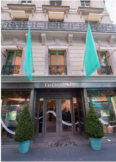
シャンゼリゼ店 外観