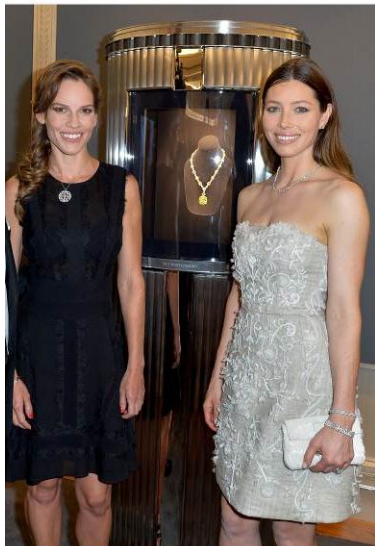
ティファニー ダイヤモンドと ヒラリー・スワンク、ジェシカ・ビール