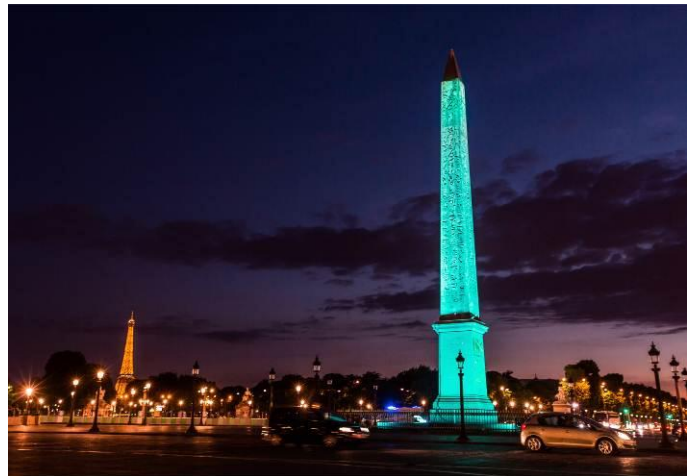
ティファニー ブルーにライトアップされた コンコルド広場のオベリスク