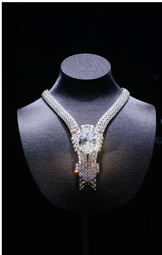
「エンパイアダイヤモンド」がセットされた新たなデザインのネックレス

ティファニーは、「ブルーブックコレクション2021」をドバイで発表いたしました。ティファニーが「ブルーブックコレクション」を中東で発表するのは、今回が初めてのこととなります。この記念すべき発表を祝して、80カラットを超える「エンパイアダイヤモンド」がセットされた、1939年国際博覧会に出展されたアーカイブジュエリーに再解釈を加えた新たなデザインのネックレスを公開しました。ティファニーがこれまでに制作したジュエリーの中で最も高価なピースとなります。11月18日～23日で開催されているドバイ国際博覧会2020の間中、ICDブルックフィールド・プレイスにて展示されます。