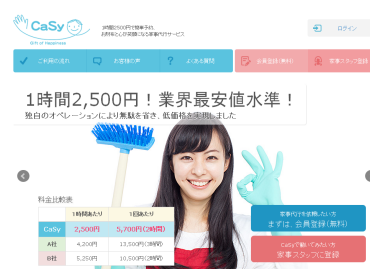
▲「CaSy」サイトトップ ( https://easy.co.jp/ )

CaSy はインターネット上から 24 時間 365 日いつでもお申込みや変更ができ、大手家事代行業者の約半額程度、「1 時間 2,500 円」で厳しい審査で選び抜かれたスタッフによる「質の高いサービス」を利用することができます。