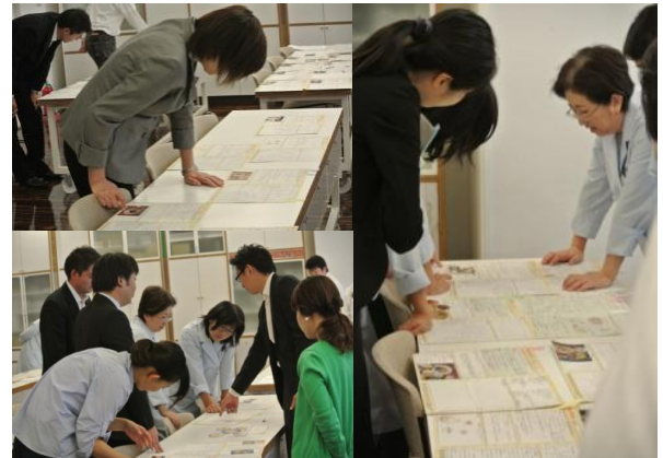
写真：今年度書類審査会より

◆炎のお料理体験から、食の大切さを感じていただく。本コンテストは、家庭における食育の浸透を目的に、2007年度から開催している、参加・体験型のお料理コンテストです。料理体験の機会を提供する事により、食生活の重要性を実感していただき、また、コンテストを通じて、親子のコミュニケーションがますます深まり、忘れられない思い出づくりの場として貢献しています。