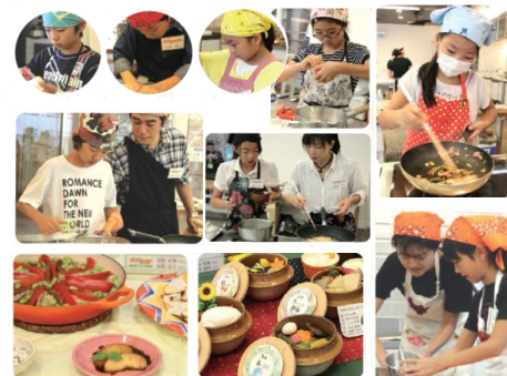
写真：昨年度東京大会より

◆炎のお料理体験から、食の大切さを感じていただく。本コンテストは、家庭における食育の浸透を目的に、2007年度から開催している、参加・体験型のお料理コンテストです。料理体験の機会を提供する事により、食生活の重要性を実感していただき、また、コンテストを通じて、親子のコミュニケーションがますます深まり、忘れられない思い出づくりの場として貢献しています。