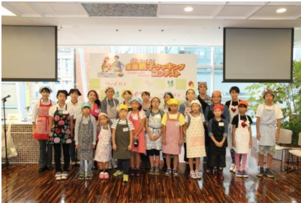
写真：昨年度東京大会より

2015年1月に開催される全国大会を目指して、東京大会、いよいよ開幕いたします。