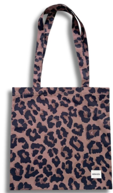
● Leopard tote bag - tote bag カラー： beige / red / navy 価格： ¥7,700 (税込) サイズ： free