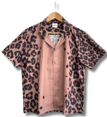
● Leopard bowling shirt - shirt カラー： beige / red / navy 価格： ¥17,600 (税込) サイズ： M / L / XL