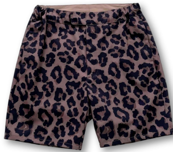
● Leopard half pants - half pants カラー： beige / red / navy 価格： ¥15,400 (税込) サイズ： M / L / XL