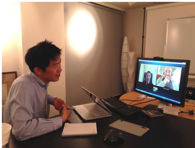
Skype会議の様子 — 東京・ブルガリア・スペイン間での3者ミーティング