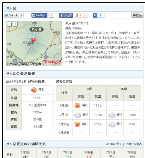
tenki.jp (PC サイト) 画面イメージ