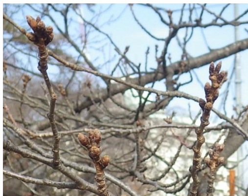
仙台管区気象台の標本木(ソメイヨシノ)の様子です。(2月23日撮影) 仙台でもこの冬は暖冬傾向ですが、まだまだ、つぼみはかたようです。