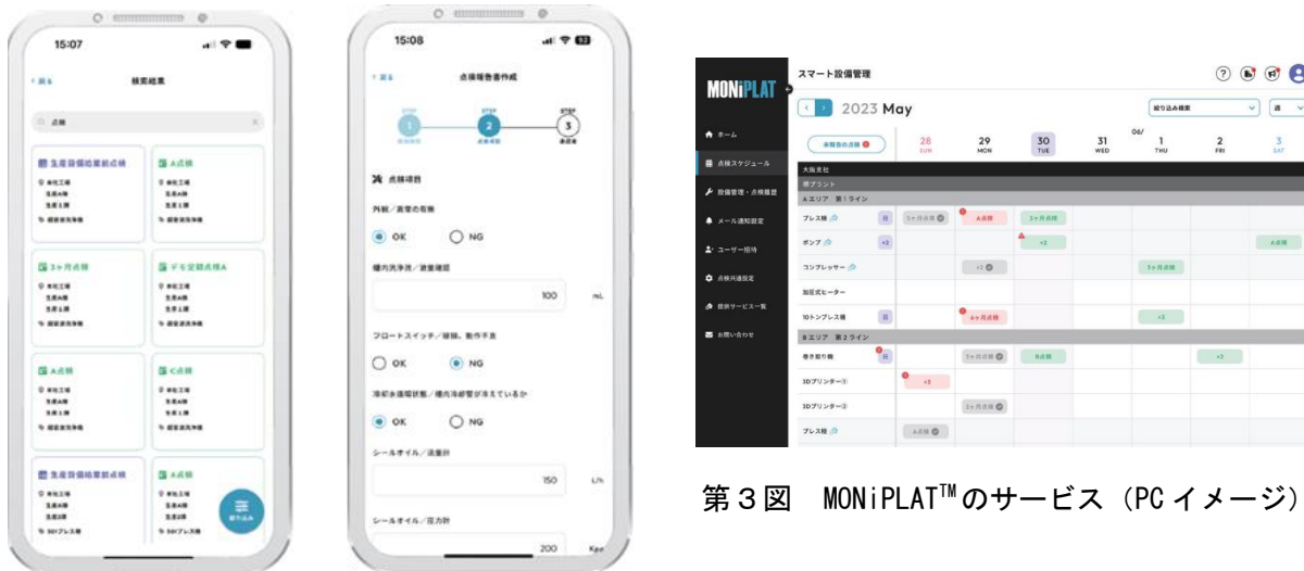
第3図 MONiPLAT TM のサービス (PC イメージ)