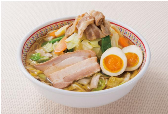
■「神座特製 春の国産野菜たっぷりラーメン」