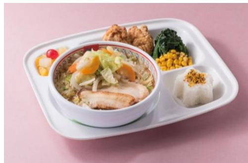
お子様メニュー：充実野菜のお子様セット(630円(税込))

1986年に大阪・道頓堀で創業した「どうとんぼり神座」は、どこのお店にも真似ができない味を追求し、開発されたラーメンは国内外問わず多くの世代の方にお楽しみ頂いております。10月30日(木)にグランドオープンする「ららぽーと和泉」のフードコート内に、大阪府内14店舗目となる「神座 ららぽーと和泉店」をオープン致します。