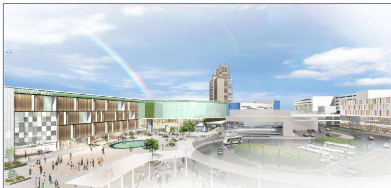
KUZUHA MALL 外観