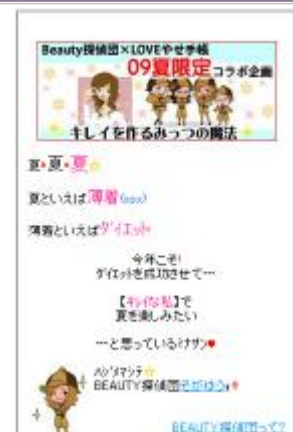
BEAUTY 探偵団 × 「LOVE やせ手帳」 タイアップ TOP ページ