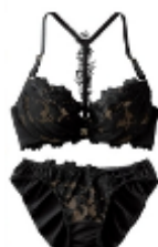
背中見せレースブラ ショーツセット ¥1990(税込)～