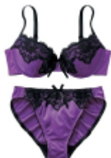
サテンブラショーツセット ¥990(税込)～