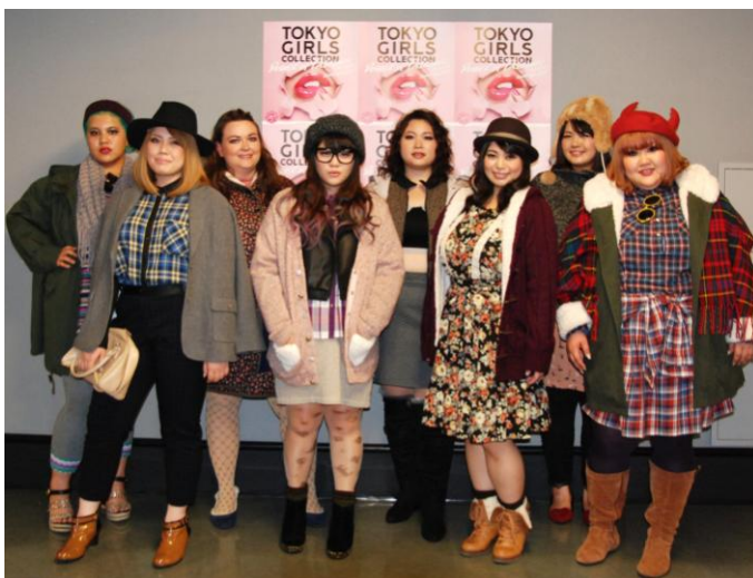
2014年9月開催【第19回 東京ガールズコレクション 2014 A/W】 「スマイルランド」初出展

「スマイルランド」は、ぽっちゃりさんが“着られる服”を提供するのではなく、“着たい服”を提供しております。《もっとトレンドの洋服が着たいけど、自分のサイズに合うオシャレな洋服がない》といったぽっちゃり女性のお悩みを解消するブランドとして、数多くのお客様にご支持を得てまいりました。