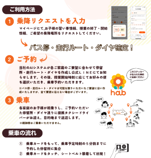
▲子ども専用送迎シャトル運行システムhab(ハブ)のサービス概要