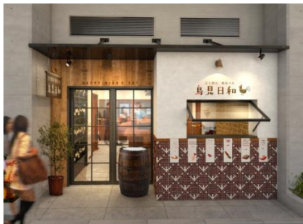
▲「鳥見日和～Happy Birds day～」