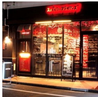
▲「スパイシーフライヤーズ」