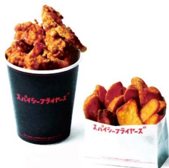
▲ダイエットチキン(左)・スパイシーポテト(右)