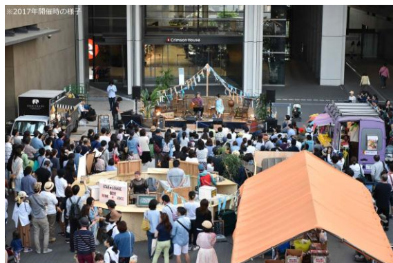
二子玉川ライズ「太陽と星空のサーカス」(2017年)の様子