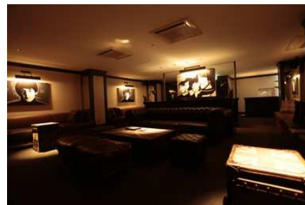
Suite room ¥50,000