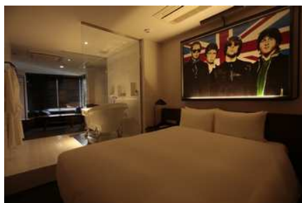
Junior suite room ¥15,000