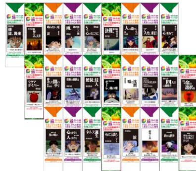
※アニメ全26話と連動したコラボパッケージ

キャンペーン期間中は期間限定コラボパッケージ※1での商品展開を行う他、様々な店頭POPなども展開し※2、クリアファイルやトートバッグなどの特典配布も行います。