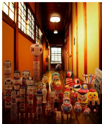
こけし&amp;マトリョーシカの部屋