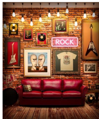
70年代ロックの部屋

特設サイトでは、唯一無二の個性派ロッカーROLLYがオリジナル楽曲に乗せてキャンペーンの応募方法をレクチャーするスペシャルムービーを同時公開。天性のキャラと独特の魅力を持つ、ROLLYワールド全開のオリジナル楽曲と、LIXILルーレットをお楽しみください。