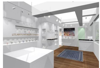
店舗外観及び内観