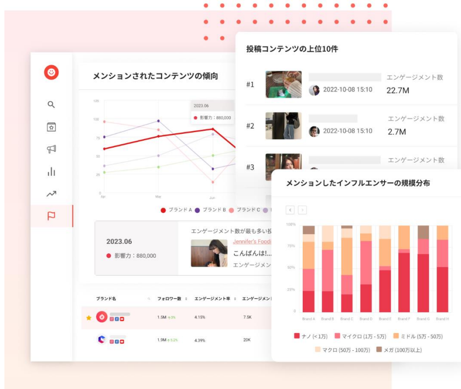
SNS コミュニケーションの状況を把握できる KOL Radar 競合分析機能の操作画面

またこの度、KOL Radar は、これまでの台湾、日本、香港、タイ、マレーシア、シンガポール、ベトナムに続き、韓国インフルエンサーデータ、70万件の拡張を実施しました。これにより、3月31日にインフルエンサーデータベースは国内外合わせ300万件を突破します。