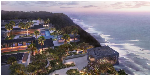
※完成予定イメージ