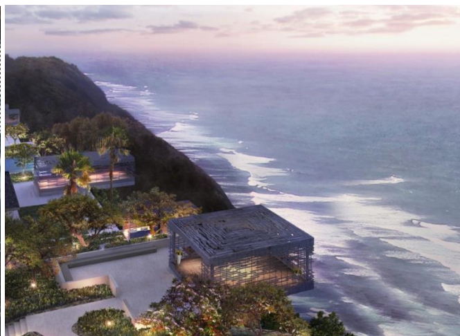
<アリラ・ヴィラズ・ウルワツ クリフエッジカバナ完成予定イメージ>