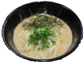
明太クリームうどん 850円