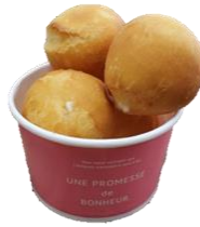
チーズボール(4個入) 450円