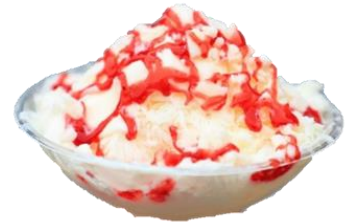
あだたらスノーアイス 500円 (ストロベリー・ピーチ・チョコ味)