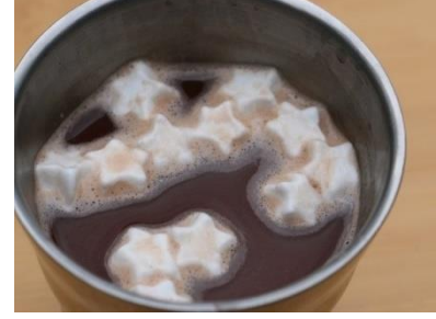
ホットチョコレート

特設ページ： https://www.yeti-resort.com/event/2023/12/star-watching-resort-yeti-14502.html