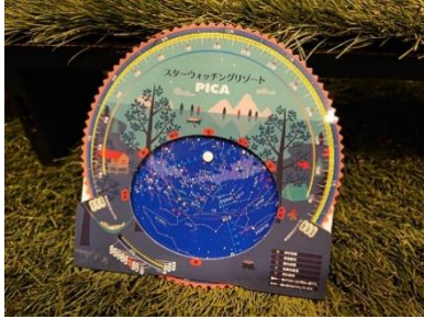
星座早見盤（レンタル）