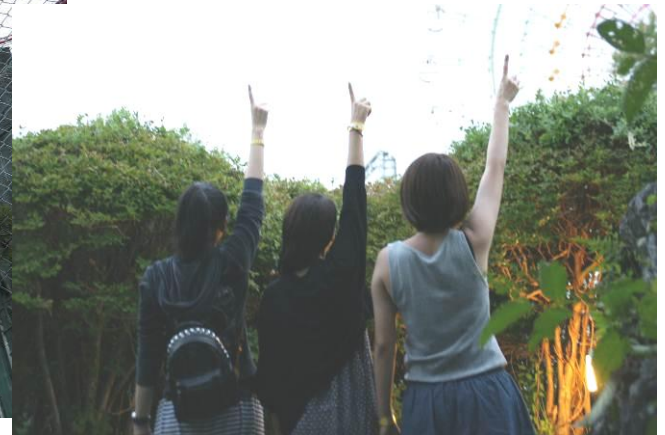
見事完全脱出を果たしたファミリー

本日9月14日(金)12時頃、富士急ハイランド(山梨県富士吉田市)の脱出迷宮アトラクション「絶望要塞」に、オープンから49日目、72132人目にして初の完全脱出成功者が誕生致しました。この偉業を成し遂げたのは、東京都在住のファミリーで、実に14回もの挑戦の末の完全脱出成功となりました。