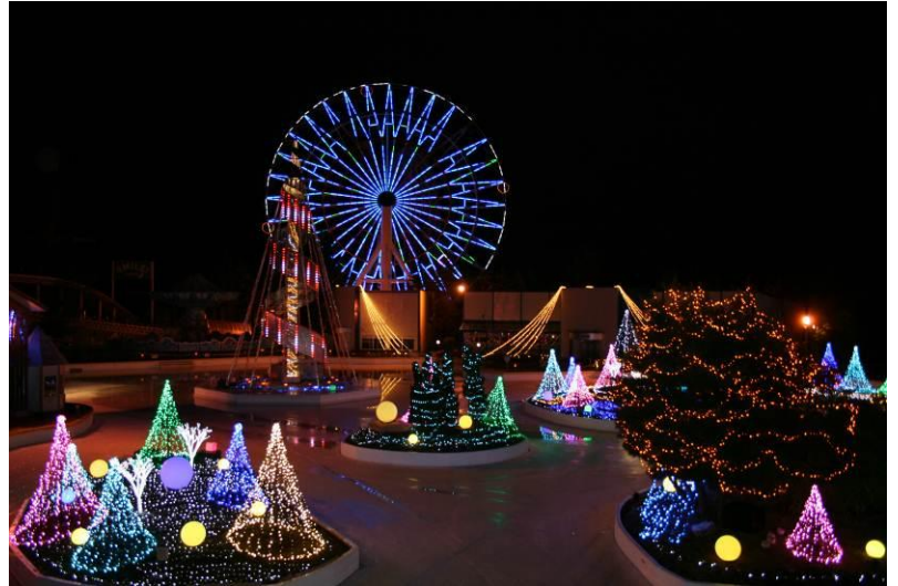
イベント会場のクリスタルラゲーンリンク