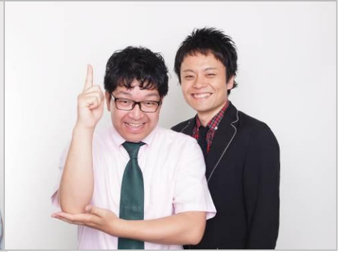
エレファントジョン