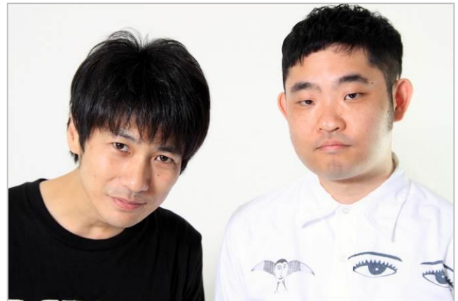
キングオブコメディ

富士急ハイランド（山梨県富士吉田市）では、2012年のラストを飾り、2013年の年明けを祝うカウントダウンイベント「絶望的カウントダウン お笑い氷上決戦！」を大晦日12月31日（月）の23時から開催致します。