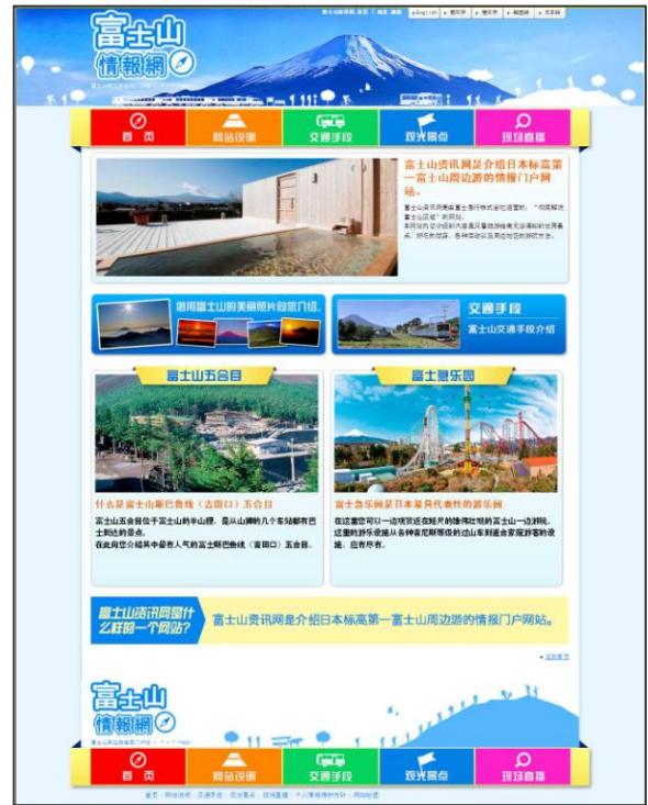
<例2> 中国語（簡体字）版トップページ 賑やかな色使いを用い、また、文字による情報量の多さを意識した構成。