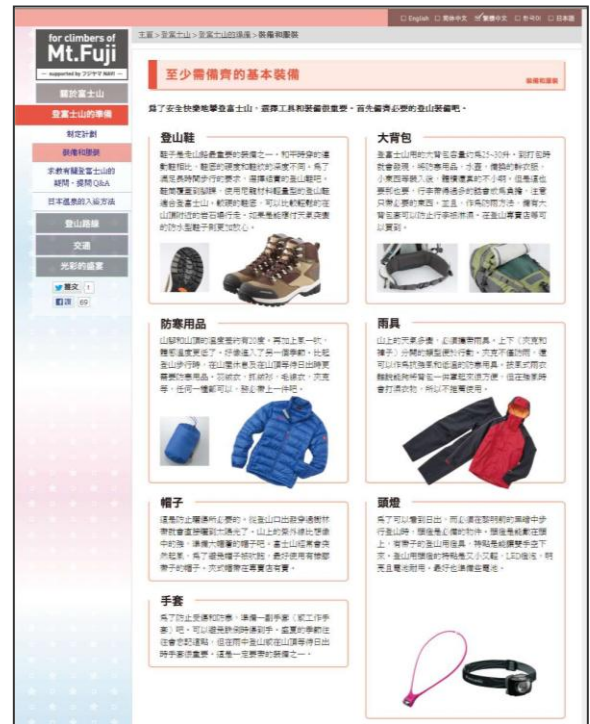
<参考2> 富士登山情報