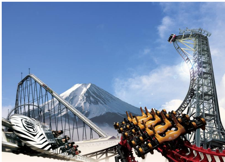
富士急ハイランドイメージ