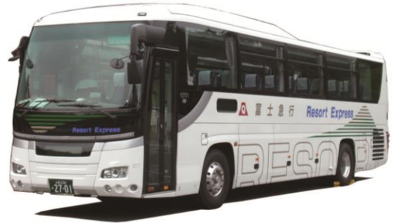
高速バス車両イメージ